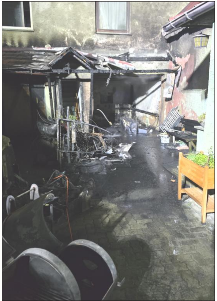
Einsatzstelle nach erfolgreichem Löscheinsatz