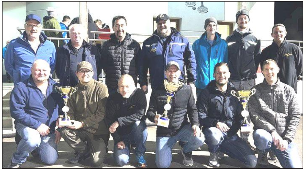
Die ersten 3 Platzierten Mannschaften beim Juxturnier 2024