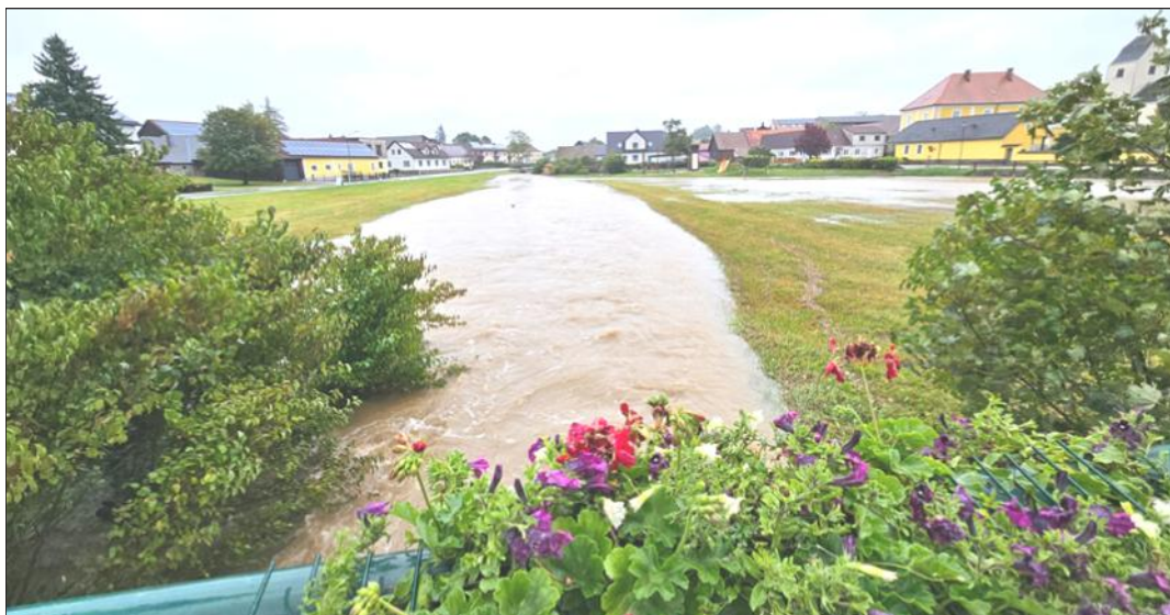
Thaya auch in Sallingstadt über die Ufer getreten

Vielen Dank an alle Kameraden, die geholfen haben dieses Großschadenersignis zu bewältigen und die vom Hochwasser geschädigten Anrainern in diesen schwierigen Stunden und Tagen tatkräftig unterstützten!