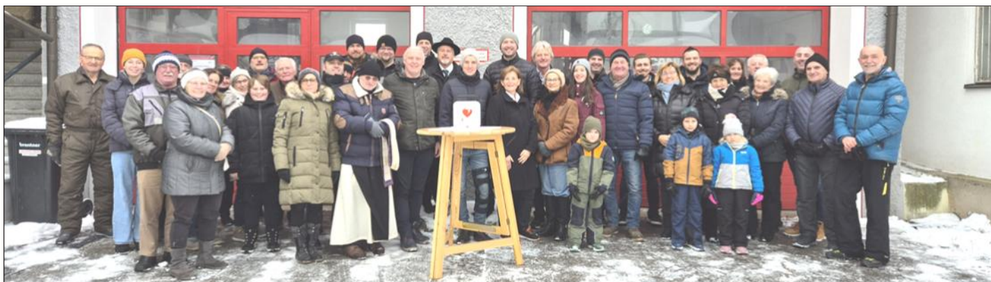
Viele sind gekommen, um gemeinsam den Defibrillator in Sallingstadt seiner Bestimmung zu übergeben.

Kameradschaftsbund. Aktuell gibt es in der Gemeinde vier Defi-Standorte: bei den Feuerwehrhäusern in Großreichenbach, Limbach und Sallingstadt sowie dem Info-Point in Schweiggers.